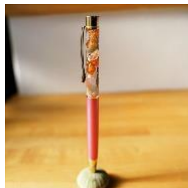
ハーバリウムシエルボールペン