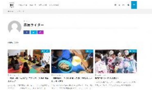
市民ライター投稿記事