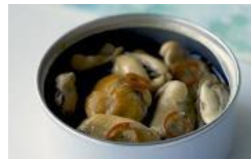
フードロス素材の缶詰