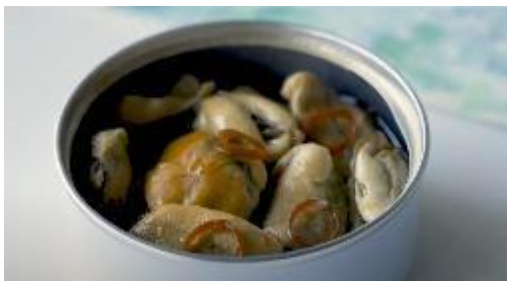
ムール貝アヒージョ缶詰 (試作品)

久美浜湾牡蠣養殖の現場で付着物として廃棄されているムール貝を活用した缶詰づくり。 生産現場を訪問し、味だけではなく食の価値を伝えるための生産者ツアーづくり。