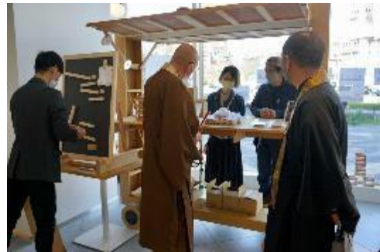
イベント会場の様子