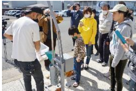
プラスチックごみによるものづくり体験