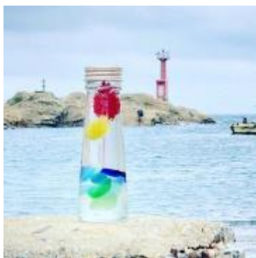
海のハーバリウム