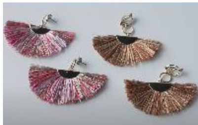
イヤリング (タッセル)