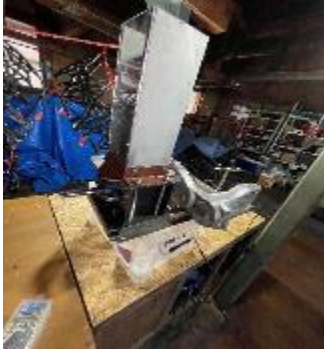
プラスチックシュレッダー

海岸清掃で得たプラスチックごみを粉砕する機械、溶解・射出成型する機械を作成。 プラスチックごみを再生可能な素材として活用する取組み