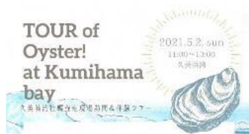
生産者訪問&体験ツアー(コロナにより延期)