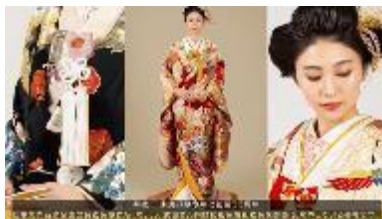
子どもの未来を紡ぐ糸